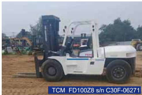
TCM FD100Z8 s/n C30F-06271