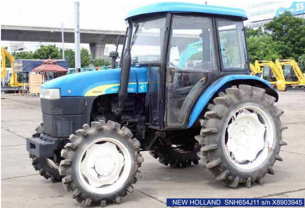
NEW HOLLAND SNH654J11 s/n X8903945