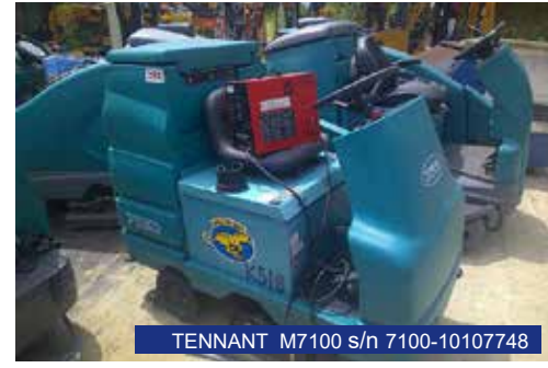
TENNANT M7100 s/n 7100-10107748