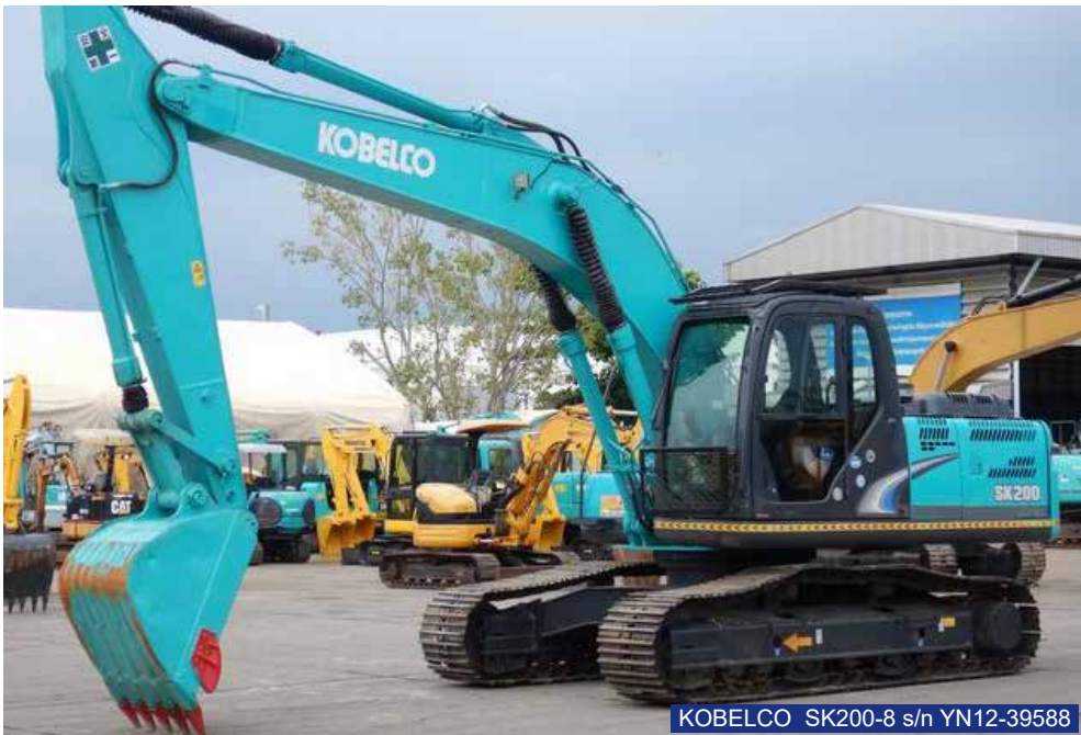
KOBELCO SK200-8 s/n YN12-39588