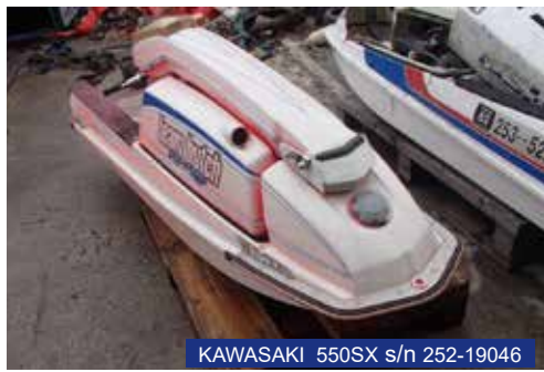
KAWASAKI 550SX s/n 252-19046