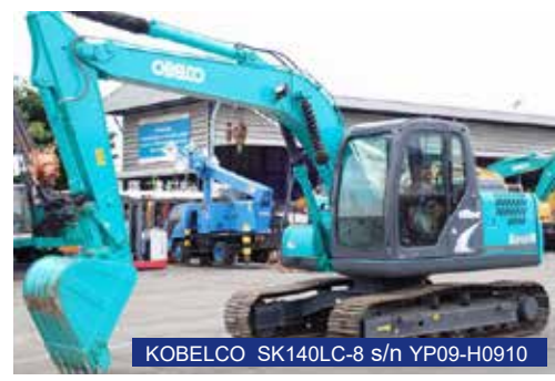
KOBELCO SK140LC-8 s/n YP09-H0910