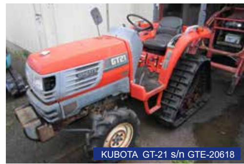
KUBOTA GT-21 s/n GTE-20618