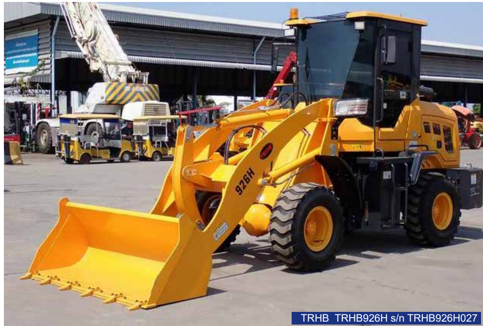
TRHB TRHB926H s/n TRHB926H027