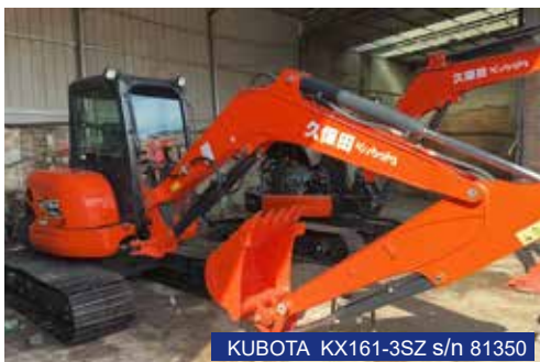
KUBOTA KX161-3SZ s/n 81350