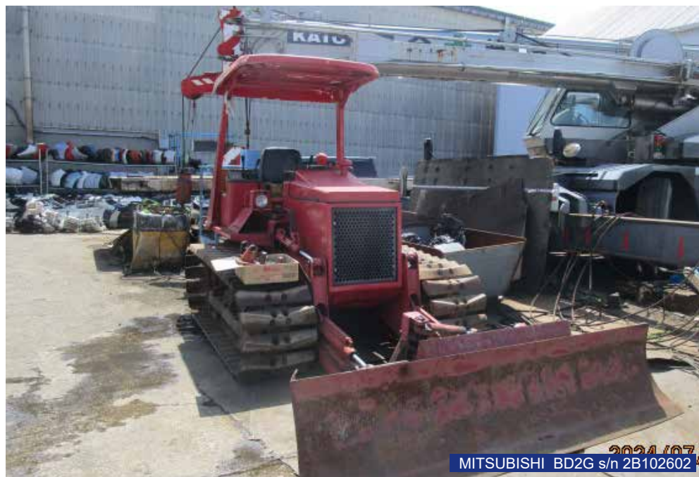
MITSUBISHI BD2G s/n 2B102602