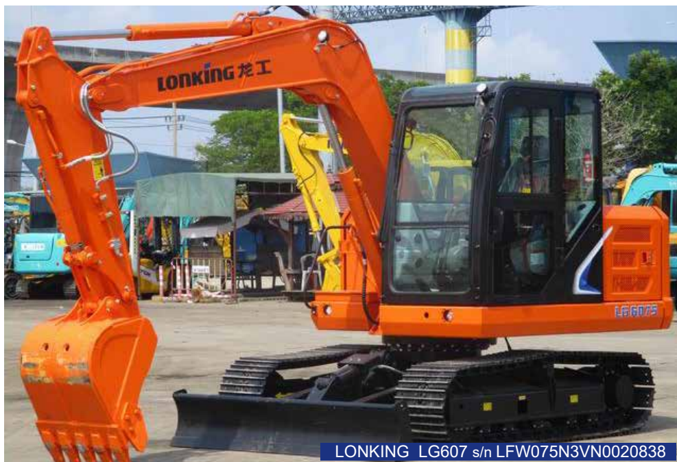
LONKING LG607 s/n LFW075N3VN0020838