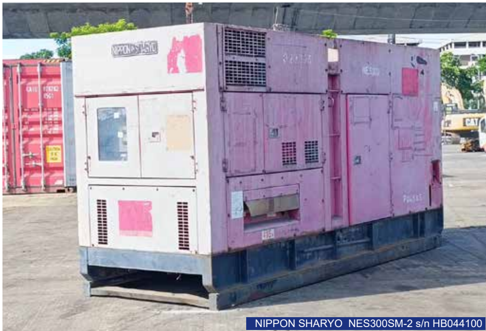
NIPPON SHARYO NES300SM-2 s/n HB044100