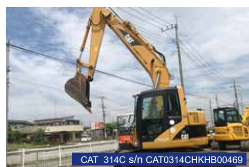
CAT 314C s/n CAT0314CHKHB00469