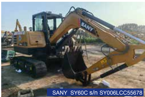
SANY SY60C s/n SY006LCC55678