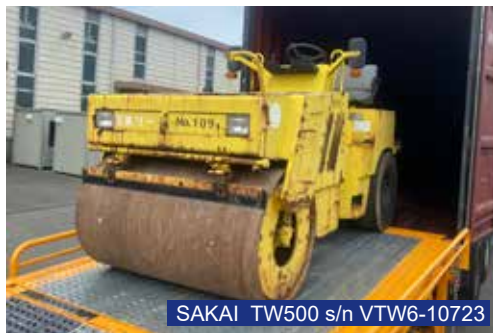
SAKAI TW500 s/n VTW6-10723