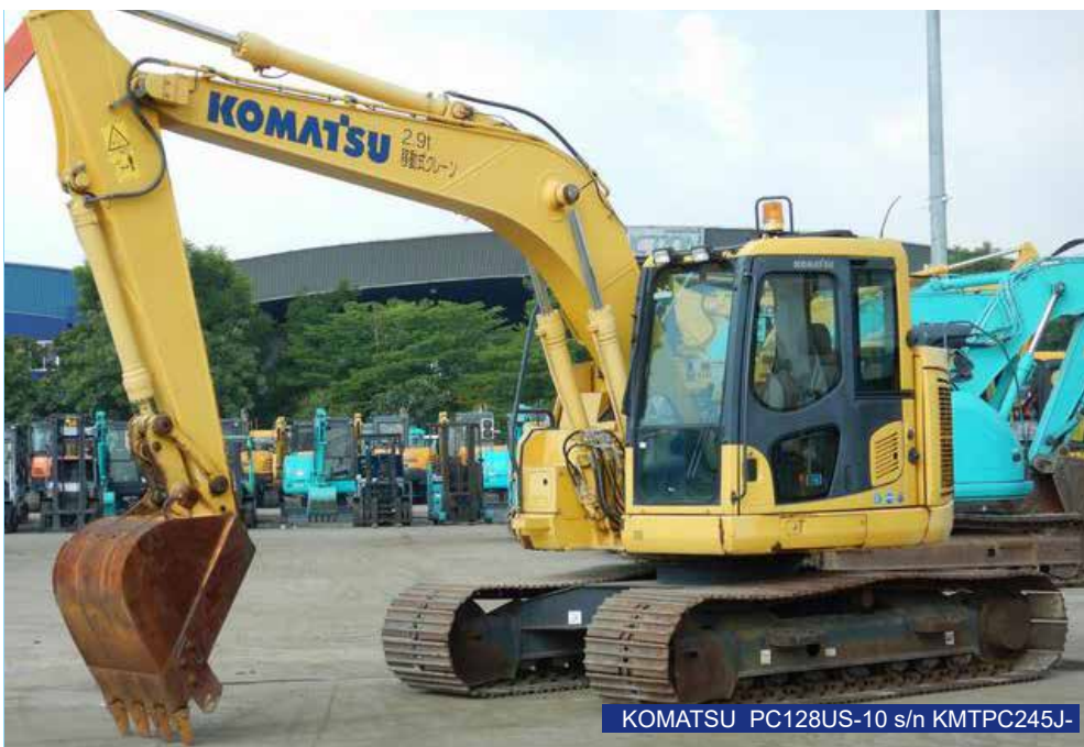
KOMATSU PC128US-10 s/n KMTPC245J-