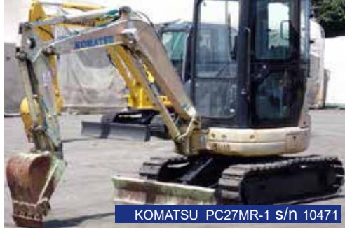
KOMATSU PC27MR-1 s/n 10471