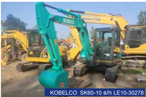
KOBELCO SK60-10 s/n LE10-30278