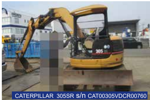
CATERPILLAR 305SR s/n CAT00305VDCR00760