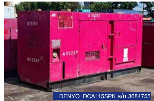
DENYO DCA115SPK s/n 3684755