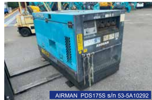
AIRMAN PDS175S s/n 53-5A10292