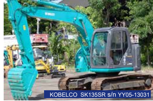
KOBELCO SK135SR s/n YY05-13031