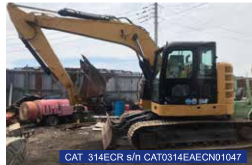
CAT 314ECR s/n CAT0314EAECN01047