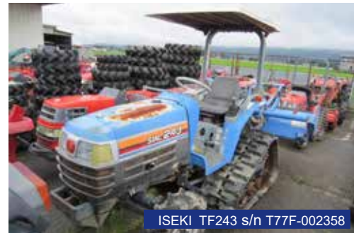
ISEKI TF243 s/n T77F-002358