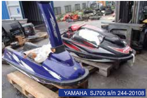
YAMAHA SJ700 s/n 244-20108