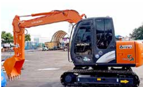
HITACHI ZX70-5A s/n HCM1CD00V00064180