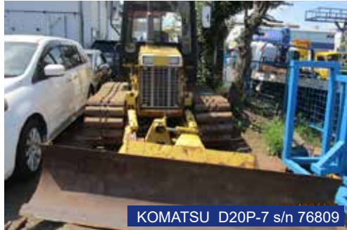
KOMATSU D20P-7 s/n 76809

กรณีที่ใช้ SHIPPING นอกบริษัท จะต้องชำระค่าเอกสารนำเข้า 550 บาท ต่อสินค้า 1 รายการ