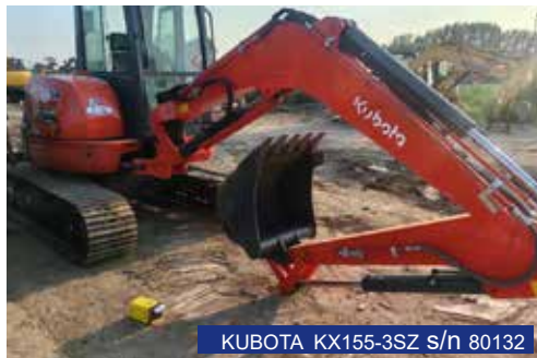
KUBOTA KX155-3SZ s/n 80132