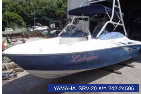
YAMAHA SRV-20 s/n 242-24595