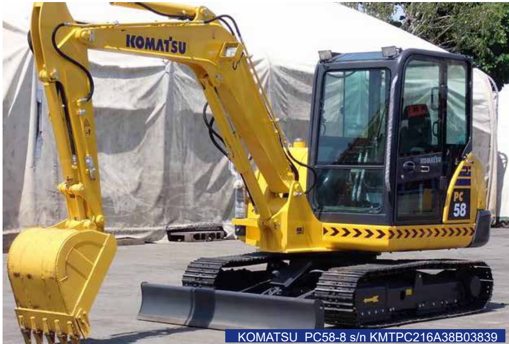
KOMATSU PC58-8 s/n KMTPC216A38B03839