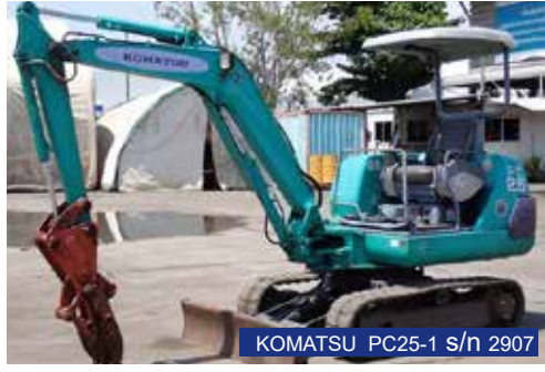
KOMATSU PC25-1 s/n 2907