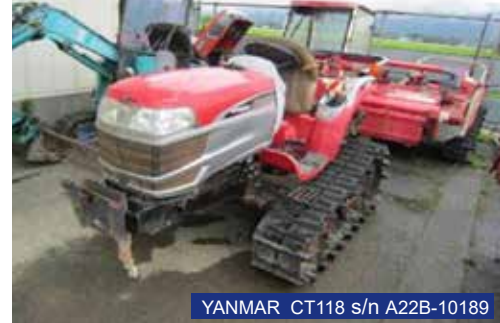
YANMAR CT118 s/n A22B-10189