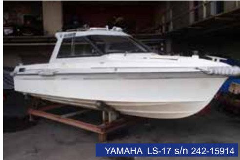
YAMAHA LS-17 s/n 242-15914