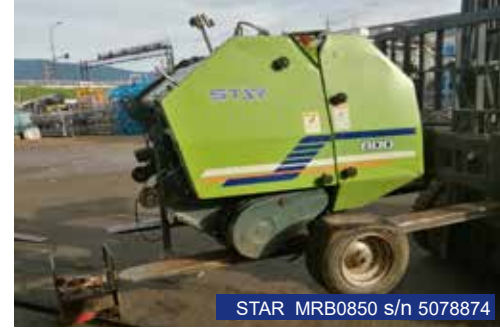
STAR MRB0850 s/n 5078874