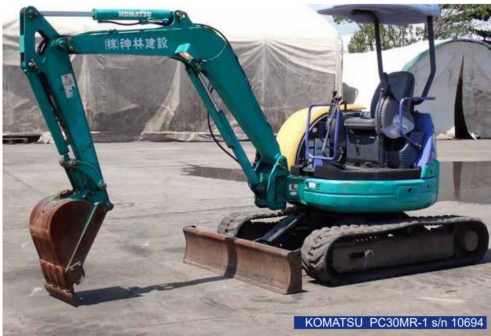
KOMATSU PC30MR-1 s/n 10694