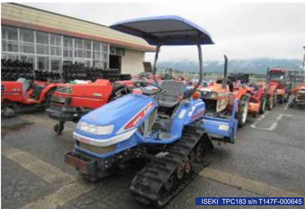
ISEKI TPC183 s/n T147F-000645