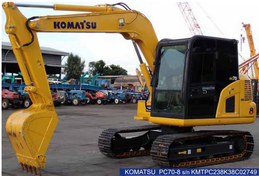
KOMATSU PC70-8 s/n KMTPC238K38C02749