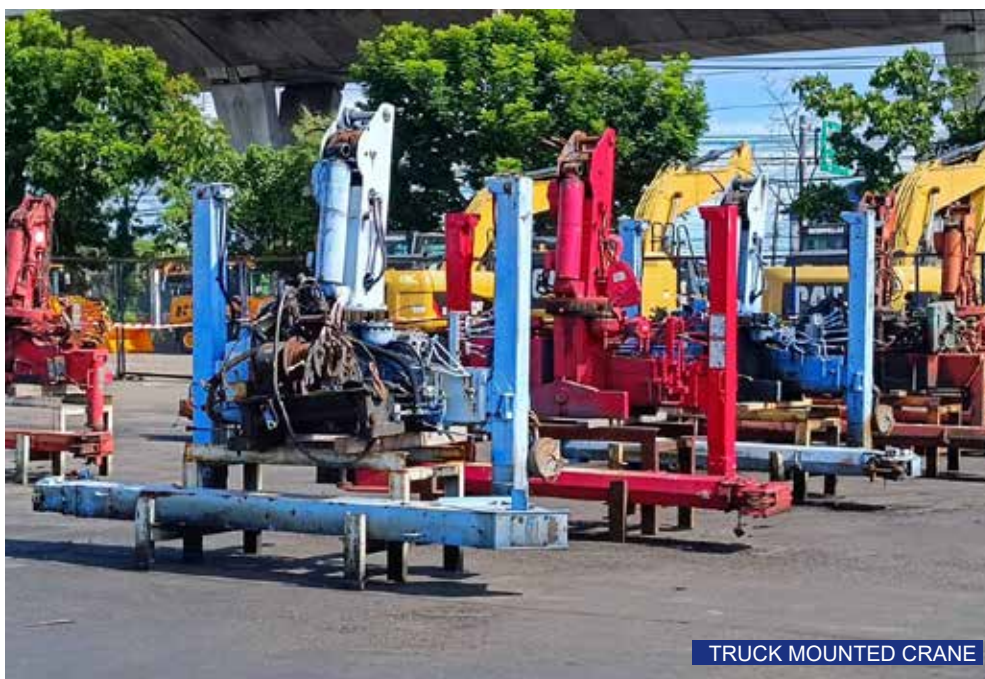
TRUCK MOUNTED CRANE