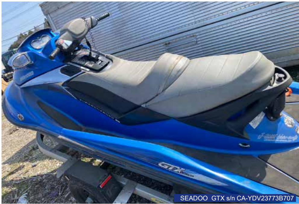
SEADOO GTX s/n CA-YDV23773B707