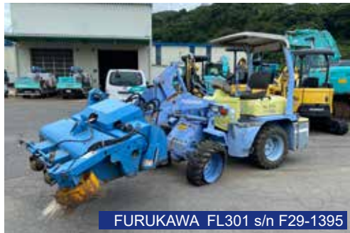
FURUKAWA FL301 s/n F29-1395