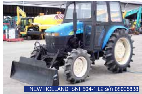
NEW HOLLAND SNH504-1.L2 s/n 08005838