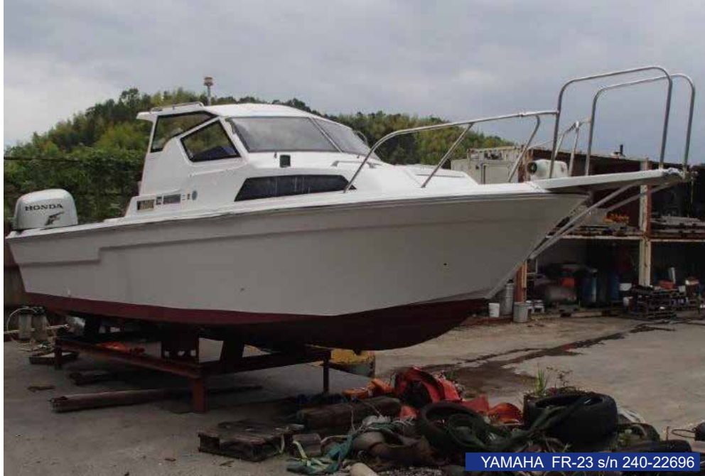
YAMAHA FR-23 s/n 240-22696